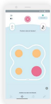
Detekce špatné polohy