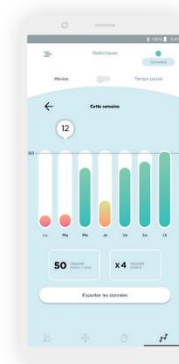
Historické a statistické údaje