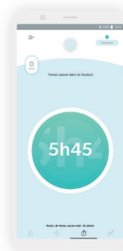
Celkový čas strávený na vozíku